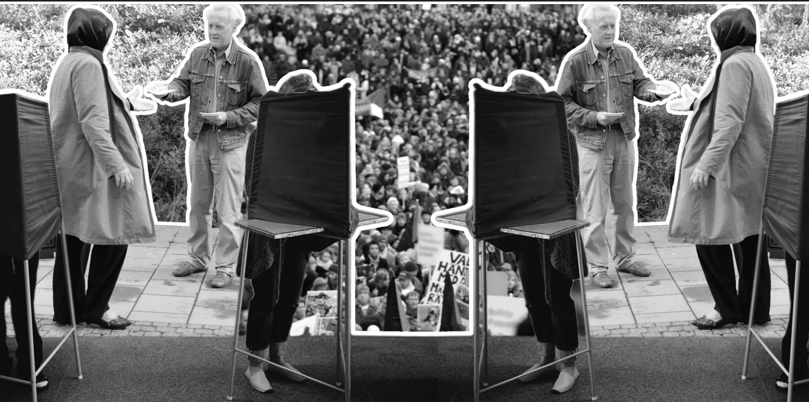
ART DIRECTION &amp; DESIGN: PÅL LINDER