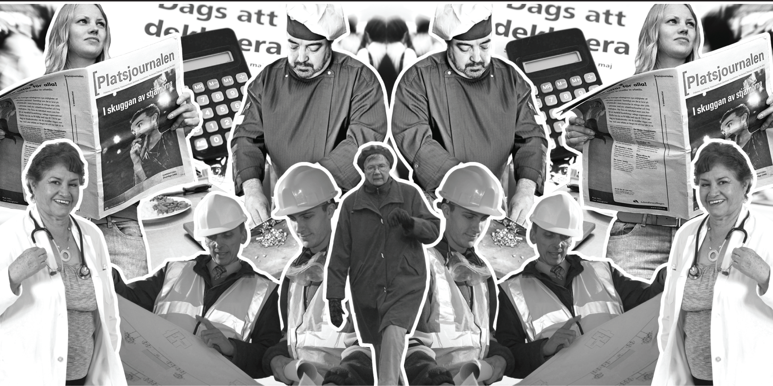
ART DIRECTION &amp; DESIGN: PÅL LINDER