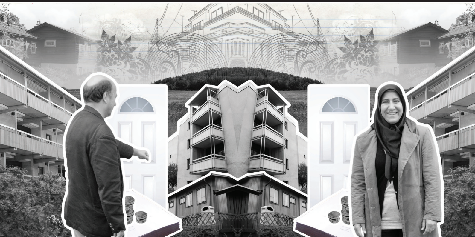
ART DIRECTION &amp; DESIGN: PÅL LINDER